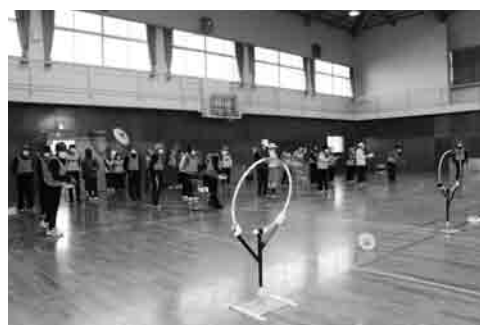
【シニアクラブスポーツ大会支援事業】 シニアクラブのスポーツ大会に助成を行い、高齢者が地域で生き生きと活動できる支援をします。